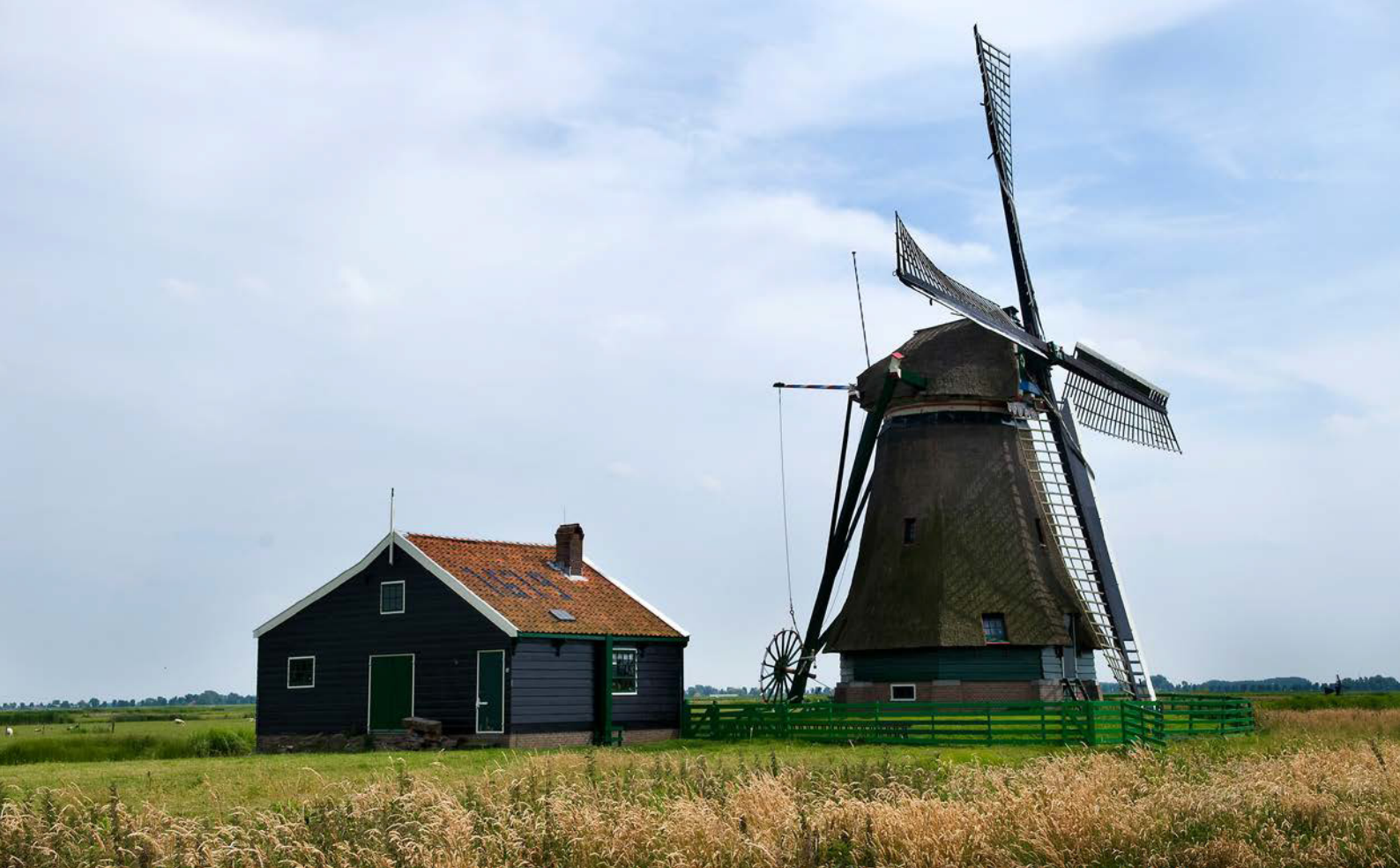
Meelmolen De Koker is in 1866 herbouwd en regelmatig open voor bezoek.