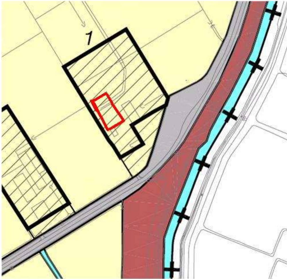
Bestemmingsplan Landelijk Gebied – bestemming agrarisch gebied met landschapswaarden (art.3) – in rood de contouren van de nieuwe stal.