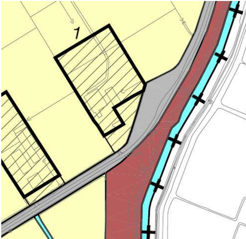
Bestemmingsplan Landelijk Gebied – bestemming agrarisch gebied met landschapswaarden (art.3).

De boogstal wordt gerealiseerd binnen het bouwvlak van het bestemmingsplan Landelijk Gebied en valt daarmee binnen bestaand bebouwd gebied (BBG). De realisatie van de boogstal is niet in strijd met provinciaal beleid.