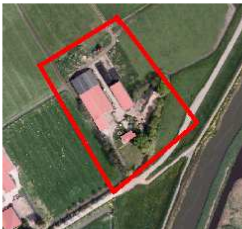
Bestaand bebouwd gebied in Provinciale Ruimtelijke verordening.