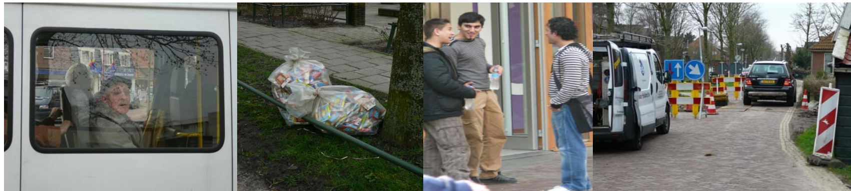
er is veel te communiceren.....

Kern: permanente info aan- en uitnodiging tot communicatie met bewoners!!