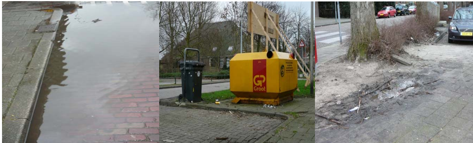
Wegenonderhoud, rioolproblemen, 'groen'overlast en 'afvaloverlast' zijn de thema's waarover de bewoners het meeste klagen.....