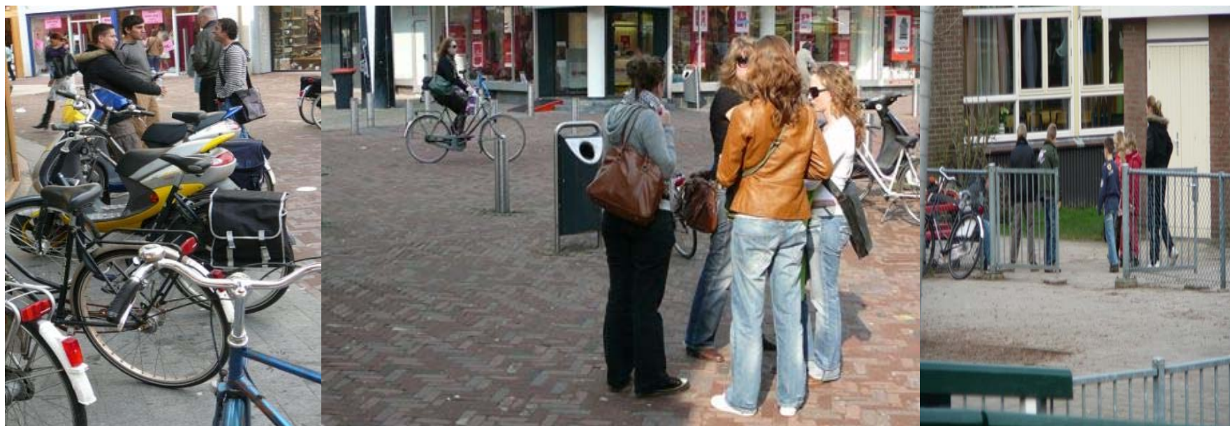
feiten en fictie over jongeren scheiden.....