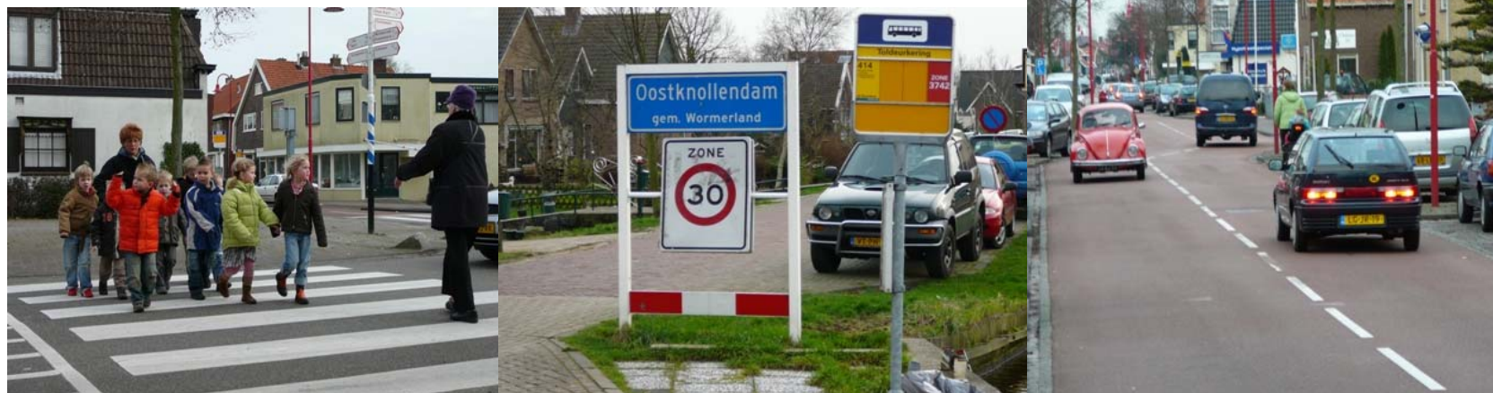
verkeer: een van de belangrijkste aandachtspunten in Wormerland