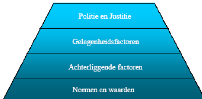
Figuur 4: Ijsbergmodel

Op basis van landelijke thema's ontwikkelt de politie regio ieder jaar een bedrijfsplan. Vervolgens geeft het politiedistrict hieraan invulling via een districtsbedrijfsplan en maakt het politie wijkteam een concept activiteitenplan, dat aan het einde van het jaar in overleg met de commissie WSB door het college wordt vastgesteld. De speerpunten van het districtsbedrijfsplan en de wijkbeleidspunten van de wijkagenten vormen onder andere de basis van dit activiteitenplan. De vier speerpunten hiervan voor 2005 zijn voor criminaliteit: geweld, woninginbraken en jeugdproblematiek en veel voorkomende criminaliteit (diefstal, af/uit auto, vernielingen en graffiti).