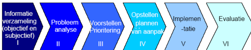
Figuur 1: Stappenplan, beleid integrale veiligheid

Onderstaand schema geeft aan hoe in zes stappen inhoud wordt gegeven aan het beleid van integrale veiligheid.